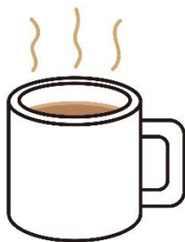
あたたかい たべもの、のみもの